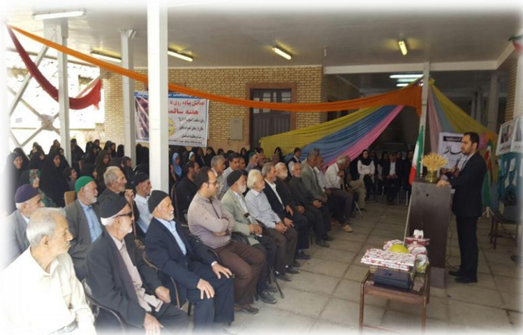
۲. غربالگری دیابت و فشار خون همراه با آموزش به سالمندان